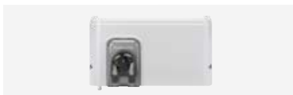
Módulo Dual Link (Regulação do pH e Redox)

Os eletrolisadores salinos são uma solução de desinfeção automática e eficaz. Simples de utilizar, o tratamento da água é completo e a manutenção reduzida.