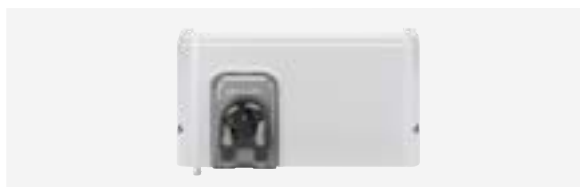
Módulo pH Link (Regulação do pH)