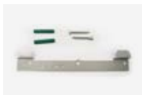
Kit de fixação de parede