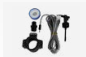
Kit de sensor de débito