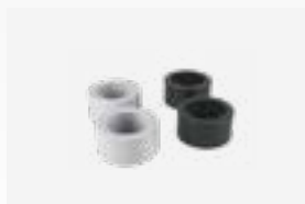
Kit de redutores a colar