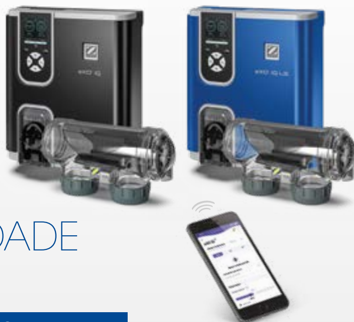
Modelos equipados com módulos de regulação de pH opcionais