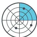
Scanner CleverClean™ para uma cobertura de limpeza máxima da sua piscina