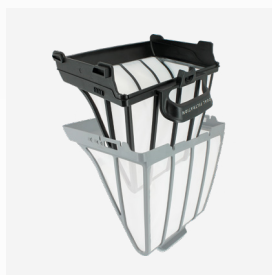
Filtro a Principal 150 µ para Dupla filtragem ou utilização sozinho