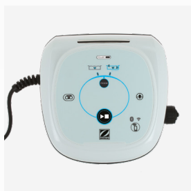
Caixa de comando