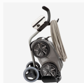
Carro de transporte