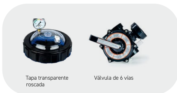
Tapa transparente roscada